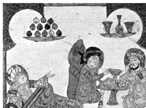
Figura 7. Imagen de médico árabe.