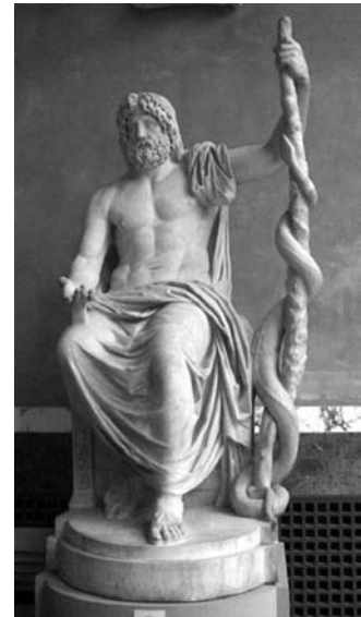
Fig 2. Estatua de Asclepio

Pronta fue la llegada de la civilización romana; como bien sabemos, el mundo romano tomó prestado del mundo griego,