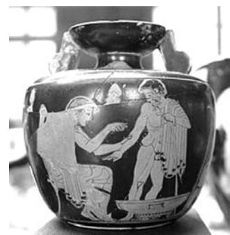
Fig 3. Cerámica griega.