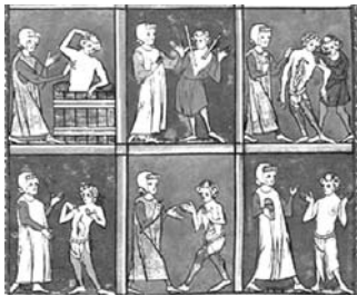
Fig. 5. Manuscrito S. XIII Escuela de Salerno.

como el más eficaz, acompañado con el rezo correspondiente pidiéndole a Dios la curación del enfermo.