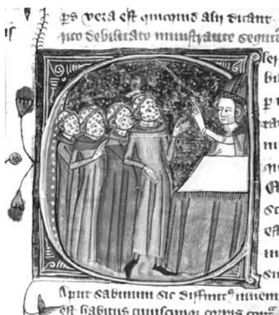
Fig. 6. Miniatura sobre la peste bubónica.

Una de las principales causas de muerte masiva durante la Edad Media, fueron las plagas o epidemias; así pues, nos encontramos con la tan temible Peste Negra, expandida por toda Europa, llegó a ser considerada una pandemia. Los síntomas eran muy variados, pero totalmente reconocibles; es el caso de la miniatura que observamos, los enfermos sufrían la aparición de dolorosos bubones en axilas, ingles, y cuello acompañados con una gran fiebre, fatiga general, tos, esputos con sangre, y hemorragias cutáneas con placas de color negro azulado, lo cual llevó a dar este nombre a la enfermedad. La figura 6 muestra una miniatura con una serie de enfermos siendo estos clérigos, lo cual implica que la enfermedad no distinguía de clases, llenos de bubones por todo el cuerpo, y un obispo bendiciéndolos; evidentemente el acto que se nos presenta es el del sacramento de la Extremaunción, puesto que los enfermos de peste negra morían en unos escasos 3 días.