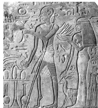
Fig 1. Relieve egipcio de la atrofia muscular.

Los egipcios, eran muy sabedores de las enfermedades